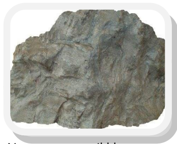
Nem te vagy a cikkben, kedves nagy kavics ala

A tájékoztatásnak is nagyon nagy a szerepe a könyvtári munkában, hiszen ekkor foglalkozunk az olvasókkal. Hogy nyers és őszinte legyek (utálok hazudni), mi valahogy nem kaptuk meg a megfelelő tudásanyagot ezen a téren, csak kis foszlányokat. Mindenkivel kedves voltam (majdnem)! Ezt az egyet nagyon megjegyeztem, ez az egyik ilyen tudáscafátka. A legnagyobb gondot az oktatásban a téren érzem, hogy a külsős gyakorlat során behajítanak minket a mély vízbe, mert eddig ilyet nem csináltunk. Sohasem kölcsönöztünk úgy