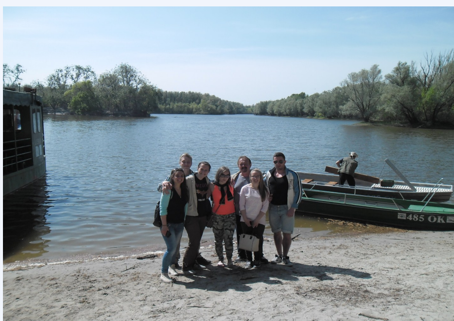
Csoportunk a Kopácsi Réten