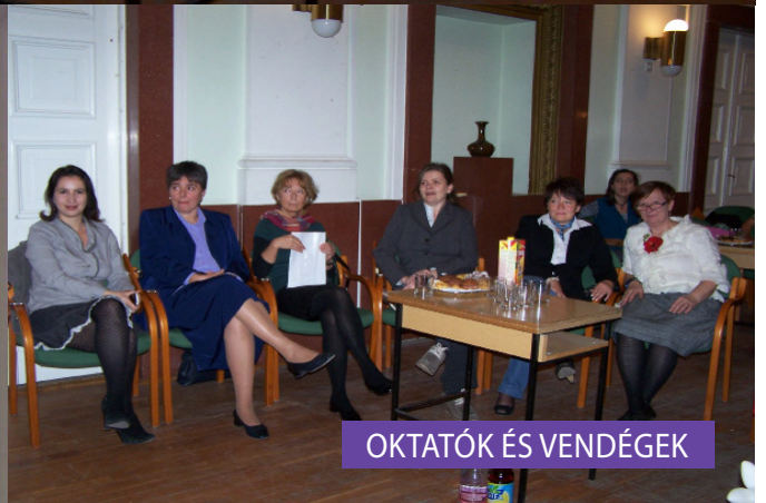
OKTATÓK ÉS VENDÉGEK