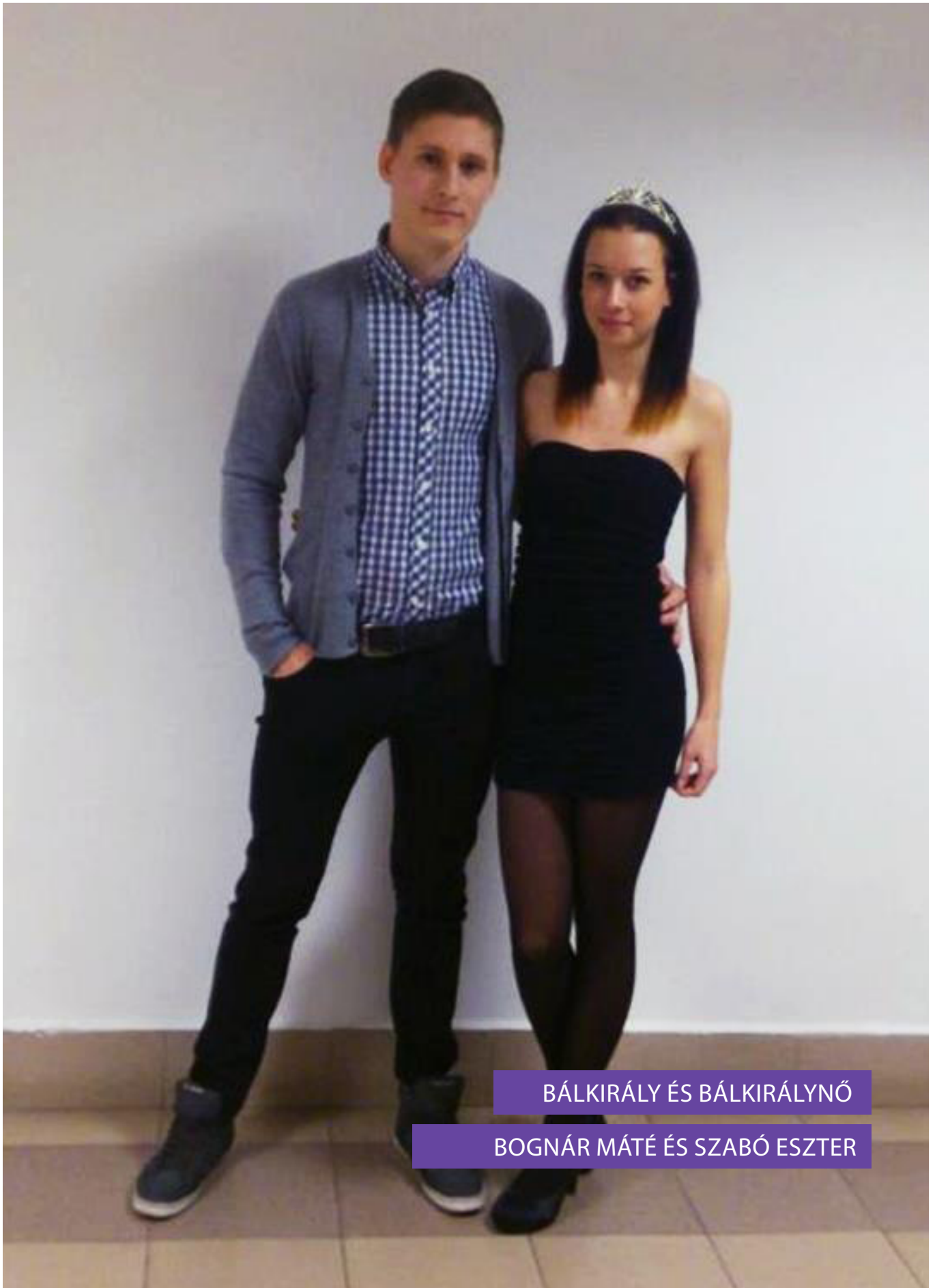
BÁLKIRÁLY ÉS BÁLKIRÁLYNŐ