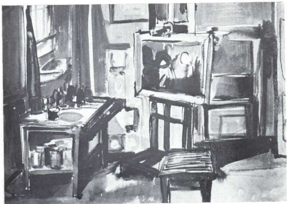
Litkei József: Műterem (akvarell)