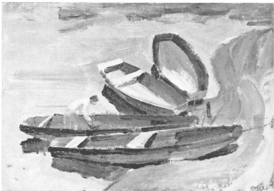
Vuics István: Csónakok (olaj)