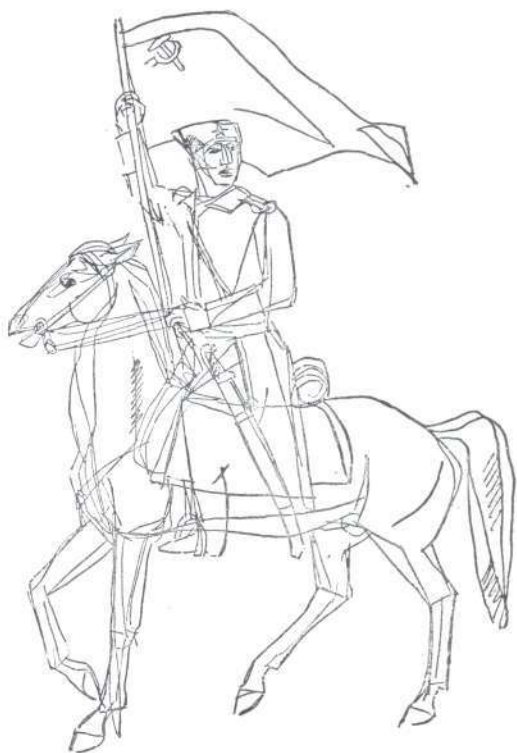
Korkos Jenő: Vörös kozák (tollrajz)