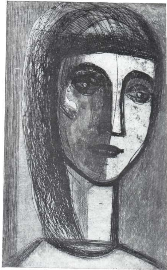
Korkos Jenő: Gimnazista (rézkarc)