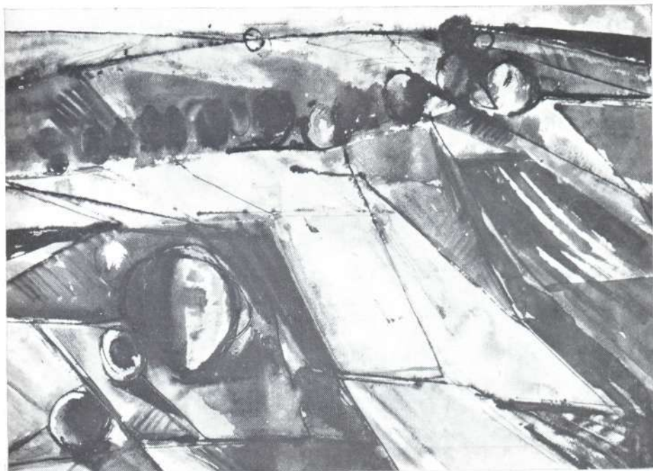
Litkei József: Tájkép (akvarell)