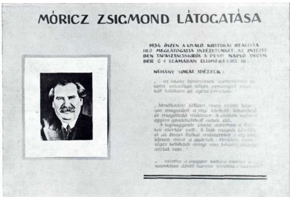
Mórlicz Zsigmond látogatását idéző tabló a kiállításról