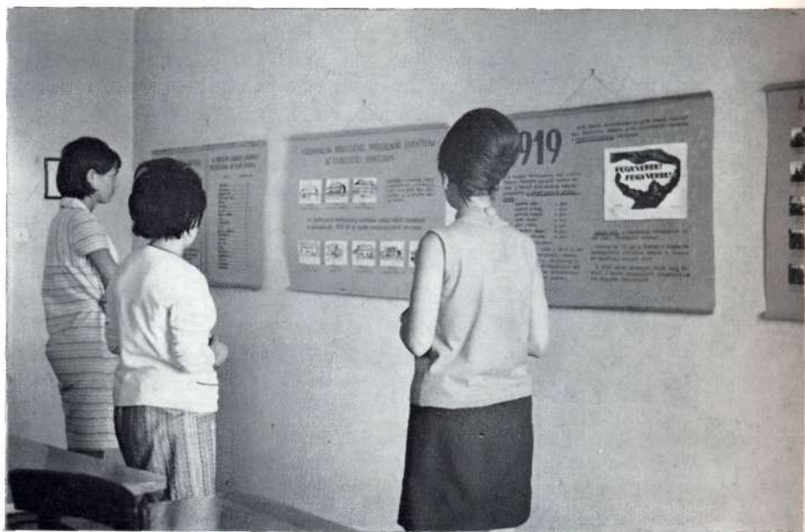
Részlet az intézet történetét ismertető kiállításról

Látható volt, hogy Magyarország vesztesként kerül ki az első világháborúból, hogy az Oroszországból kiinduló polgári demokratikus forradalom szelei hazánkat