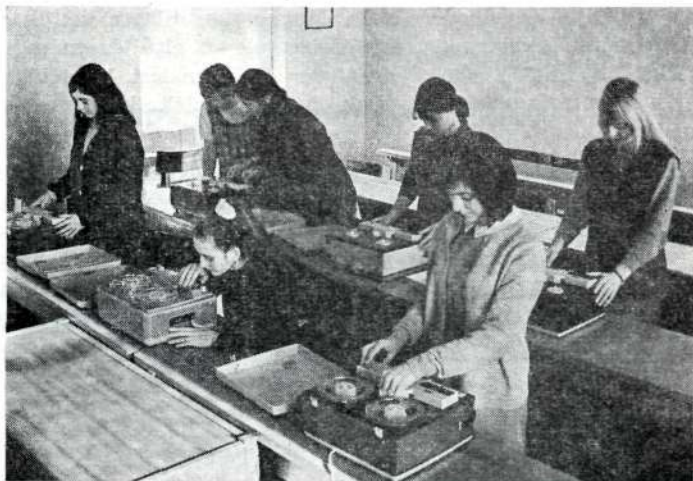
„Az oktatás technikai eszközei” órán ismerkedés a magnetofonnal