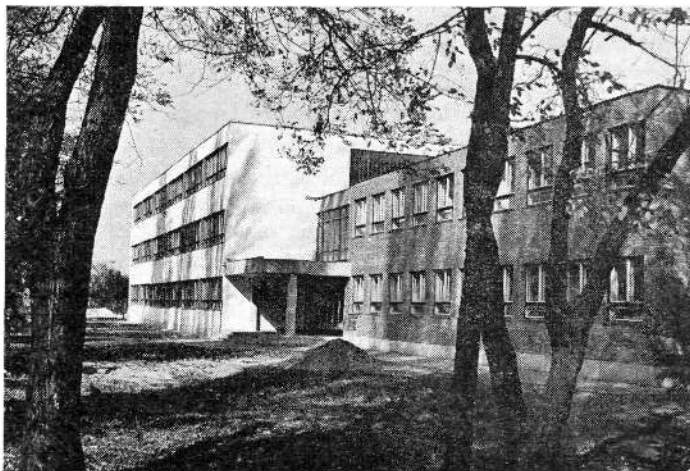
Az új gyakorlóiskola

1969 tavaszán tanácsi és minisztériumi közös beruházásból megkezdődött a 16 tantermes új gyakorlóiskola és 60 személyes tanyai általános iskolai diákotthon építése. Az 1970/71. tanévet némi késéssel már az új épületben nyitottuk meg 8 x 2 párhuzamos osztállyal, 425 tanulóval, köztük a tanyai diákotthon 68 lakójával. A diákotthonban elhelyezett tanulók száma a tanév végére 85-re emelkedett. Ez egyúttal azt jelenti, hogy a város tanyai iskoláinak nagy részét sikerült szakrendszerű oktatáshoz segíteni.