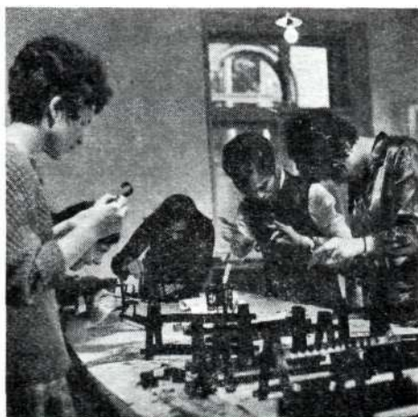
Gyakorlati foglalkozás órán

Az 1970—71. tanulmányi évben bevezetésre került új tanterv a matematika oktatását a III. évfolyamon is előírja, új tantárgyként pedig bevezette az egészségtan tanítását a III. évfolyamon. Ugyanez a tanterv viszont törölte a tanítóképző intézet tantárgyai közül az anatómia-fiziológia, a mezőgazdaságtan és a földrajz tantárgyakat; eddig ezek oktatása is a mi szakcsoportunk feladata volt.