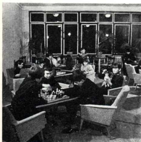
Az általános iskolai diákotthon klubszobája

A bizottságunk feladatának tekinti, hogy a tanulmányi kirándulásra utazó csoportok számára mindig ajánljon színházi műsort, tárlat-, múzeumlátogatást. Többnyire a színházjegyek beszerzését is vállaljuk. Az intézet minden évben 20 bérletet vásárol az ORI által szervezett ifjúsági hangverseny-sorozatra, amelyeket a kiemelkedő munkát végző hallgatók számára a KISZ-szervezet oszt ki. Ugyancsak hozzájárulunk a budapesti kirándulások alkalmával szervezett színház- és operalátogatások jegyeinek megvásárlásához a hallgatónként költségvetésszerűen biztosított 20 Ft-ból. (Ez a jövőben 50 Ft-ra emelkedik.)