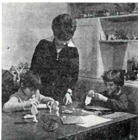
Lélektani kísérlet a tanulókkal

Az utóbbi három évben a szakcsoporti munkatervi feladatokon kívül végzett említésre méltó teljesítmények közül kiemeljük a kísérleti intézeti nevelési terv, majd a nevelési program elkészítését, a pedagógiai kabinet és a tudományos diákkör létrehozását, a pszichológiai laboratórium továbbfejlesztését. Sokat tett a szakcsoport a csoportpatronáló tanári munka legjobb módszereinek a feltárásában s a hallgatók hivatástudatának, hivatásszeretetének elmélyítésében is. 1968-ban a szakcsoport vezetője az intézeti tanács előtt beszámolt a megnövekedett hatáskörű szakcsoporti vezetésről, a pedagógiai szakcsoport munkájáról.