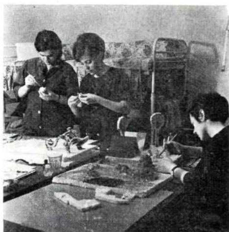
Készülés a másnapi szemléltetésre

A Kollégiumi Bizottság legfontosabb feladatának tartja a színes, tartalmas, mindenki számára vonzó program kidolgozását, mert ez a biztosítéka az aktív közösségi élet kibontakozásának. A program központi helyén szerepel a tanulmányi munka támogatása . Ezen a területen is támaszkodunk a már kialakult hagyományokra. Minden évben szervezünk tanulmányi versenyt, amelynek a tanulmányi munkán kívül része a közösségi tevékenység is (rendezvények szervezése, látogatása, társadalmi munka, a házirend betartása stb.). A verseny győzteseit ingyenes kirándulással, könyvvel ju-