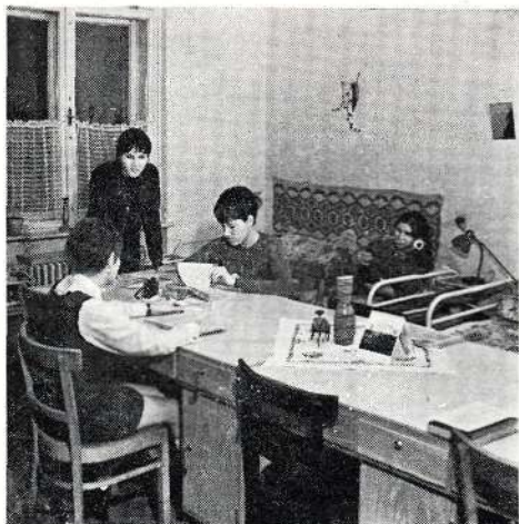
Délután a szobában

talmazzuk. Hagyományaink közé tartozik az is, hogy a II. évfolyam hallgatói az elsőéveseket patronálják. A tanulmányi munka segítése érdekében konzultációkat szervezünk, jutalmazunk, de ha kell, felelősségre is vonunk.