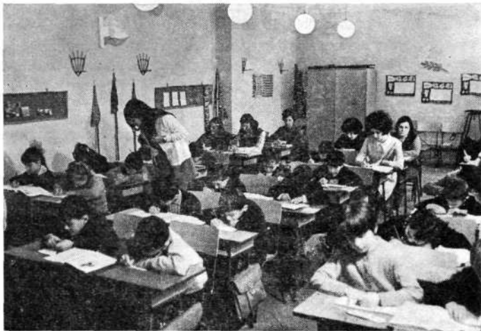
Tanítási gyakorlat a gyakorlóiskolában

és gyakorlati képzés egységét nagyon nehezen lehetett biztosítani; sem az elméleti tárgyak oktatói, sem a gyakorlóiskola nevelői nem kényszerültek arra, hogy sajátjuként érezzék a gyakorlati képzés ügyét.