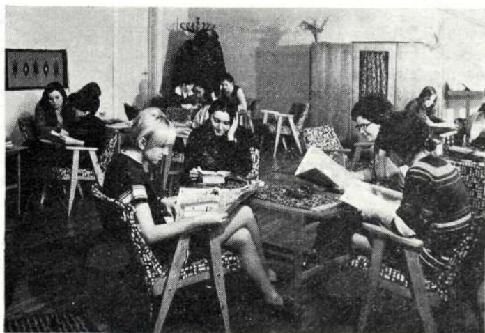
A hallgatók klubszobája

Nemzeti ünnepeink alkalmával rendezett intézeti ünnepségeink tartalmukban és kivitelezésükben is példamutatóak voltak. Ifjúságunk felelősséggel, időben felkészülve tartotta meg valamennyit. Jól bevált hagyomány, hogy minden ünnepélyt más-más évfolyam rendez. Az évfolyamok közötti egészséges versenyszellem is biztosította a színvonal fokozatos emelkedését. Ugyanilyen várakozásteljes esemény volt minden évben a műsorral egybekötött gólyabál, a tavaszi Hallgatók Napja, a végzők búcsúztatása a ballagás alkalmával. Mindezek az intézeti közösséghez való tartozás szálait erősítik, a diákévek emlékeit gazdagítják. Főképp a Hallgatók Napja ad ehhez sok alapot. Ekkor történik a tanítási verseny — amelynek győzteseit az „Adattár”-ban közöljük is —, de a diákélet humorát is itt szedik csokorba.