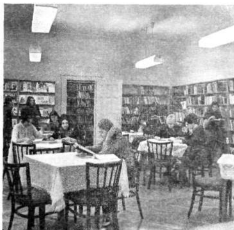
Az intézet könyvtárának olvasóterme

Allománygyarapításra az intézet költségvetéséből évi 40—45 ezer forintot fordítunk. Ezt az összeget a Könyvtári Bizottság segítségével tervszerűen költjük el. Törekvésünk, hogy a legfontosabb alpmunkákból, amelyek kötelező olvasmányok lesznek, egy tanulmányi csoport létszámának megfelelően 20—25 példányt vásároljunk.