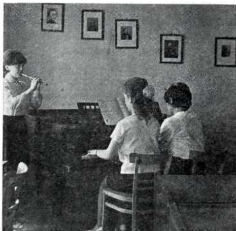
A zene nyelvén

Szakcsoporti értekezleteinken is foglalkoztunk azokkal a kérdésekkel, melyek elősegíthetik oktató-nevelő munkánk hatékonyságának növelését. Megtárgyaltuk az általános iskolai tantervi anyaghoz kapcsolódó zenei jelrendszer kutatásával, módszertani felhasználásával kapcsolatos problémáinkat; megvitattuk, hogy tárgyunk sajátos esztétikai, érzelmi adottságaival hogyan járulhatunk hozzá hallgatóink világnézetének formálásához; a hallgatók csoportvezetőinek bevonásával feldolgoztuk az ifjúságpolitikai határozatot.