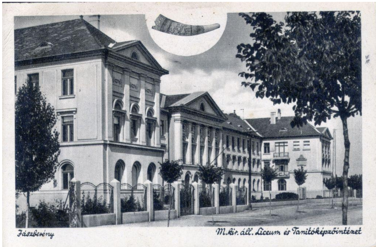
Magyar Királyi Tanítóképző Intézet